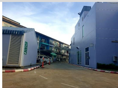
ระบบการจราจร