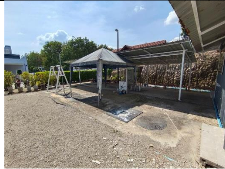
ระบบบำบัดน้ำเสีย