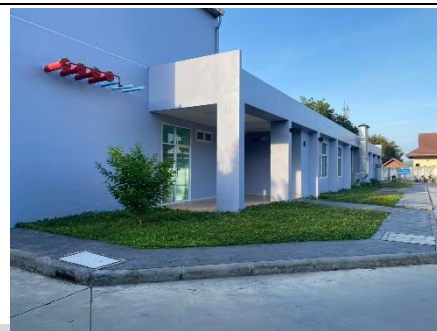
อาคารสับสนุน