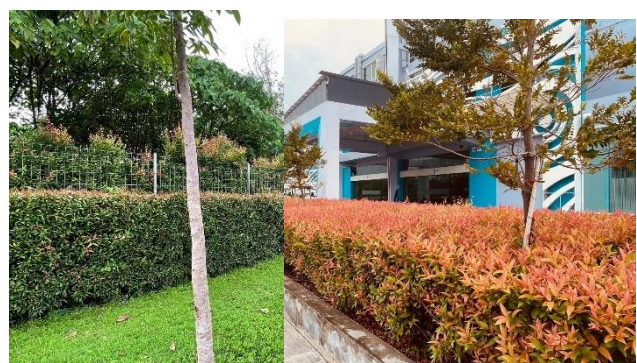
พื้นที่สีเขียว

รูปที่ 1.6-2 ภาพถ่ายสภาพปัจจุบันของพื้นที่โครงการ