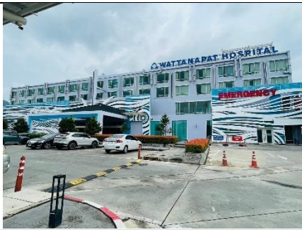
อาคารหลัก