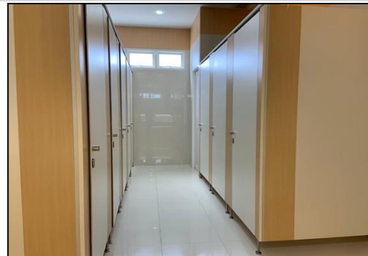
ห้องน้ำรวมหญิง