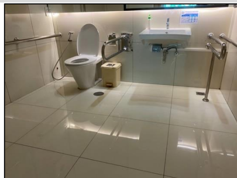
ห้องน้ำสำหรับผู้พิการ ทูพลสภาพ และคนชรา