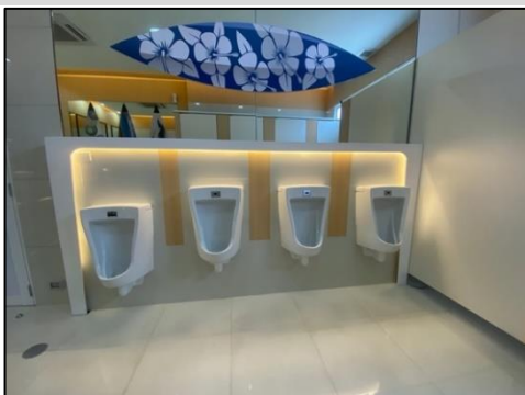
ห้องน้ำรวมชาย