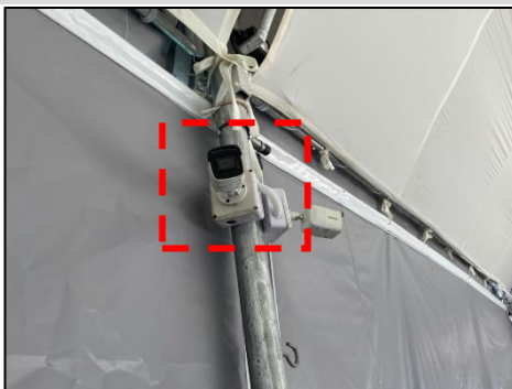
ระบบรักษาความปลอดภัย