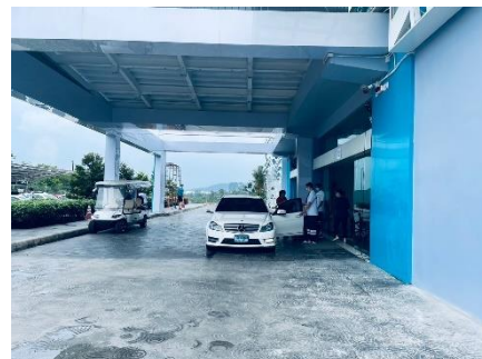
จุดจอดรถรับส่งผู้ป่วย