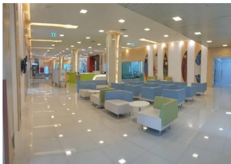
จุดบริการผู้ป่วยนอก