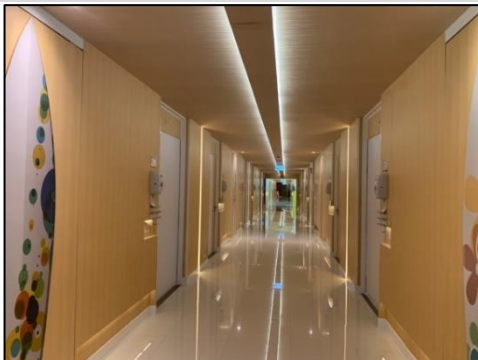
ทางเดินบริเวณหน้าห้องพัก