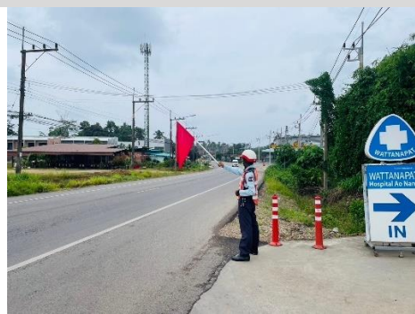
ระบบการจราจร