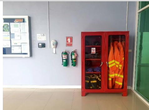
ระบบป้องกันอัคคีภัย