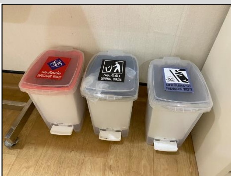
การจัดการมูลฝอย