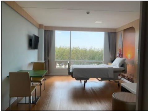
ห้องพักผู้ป่วย