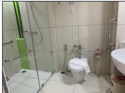
ห้องน้ำ-ห้องส้วมภายในห้องพัก