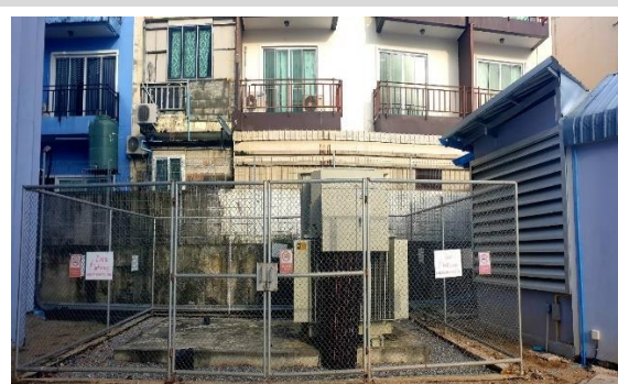
ระบบไฟฟ้า

รูปที่ 1.6-4 สภาพปัจจุบันของระบบสาธารณูปโภคต่างๆของโครงการ