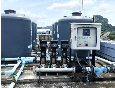
ระบบน้ำใช้