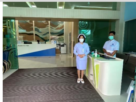
จุดคัดกรองระบบทางเดินหายใจ