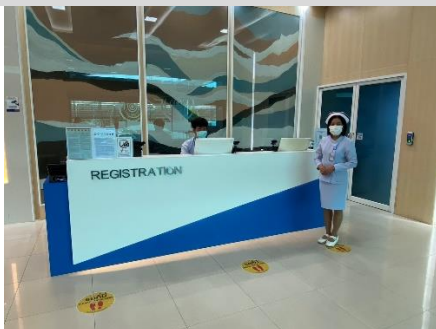
จุดคัดกรอง