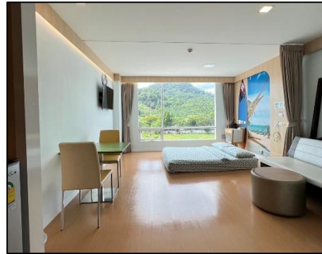
ห้องพักผู้ป่วย (สำหรับเด็ก)